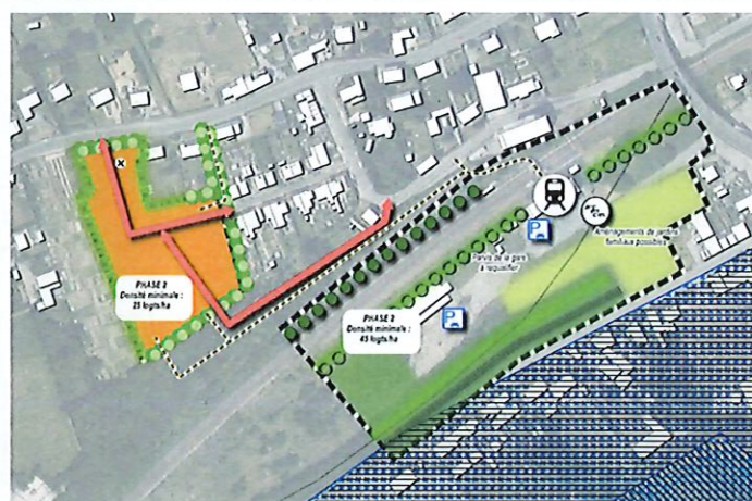
Modification OAP LAN03

Il semblerait pertinent de justifier le maintien des principes d'accès et de voirie interne. En effet, l'OAP préconise trois accès. L'accès au sud se situe sur une friche ferroviaire boisée sur laquelle seul le principe de cheminement doux paraît justifié. Le maintien de deux accès rejoignant les routes existantes (D959 et Cité des Bonnetiers) semble plus approprié à la surface du site et permettrait une limitation des coûts sur le site de projet.