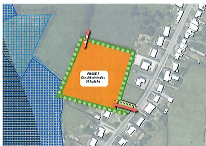
Modification OAP LAN04

Les OAP permettent de faire figurer un principe d'emprise au sol. Compte tenu de la proximité des zones humides du SAGE et du SDAGE, l'OAP LAN04 pourrait bénéficier de l'usage de ce principe afin d'encourager une implantation du bâti adaptée au site.