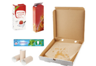
Emballages en carton