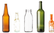
Bouteilles en verre