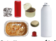
Emballages en métal et les petits aluminiums